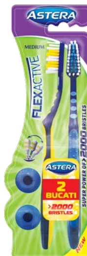
Zubní kartáček 1+1 MEDIUM