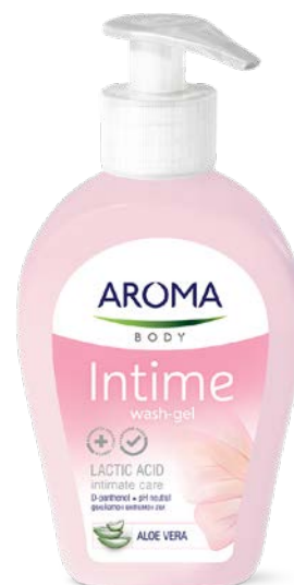
GEL NA INTIMNÍ HYGIENU ALOE VERA