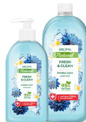
Mýdlo na ruce SVEŽÍ A ČISTÍČI