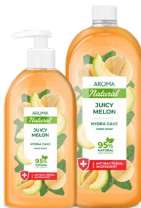
Mýdlo na ruce ŠŤAVNATÝ MELOUN