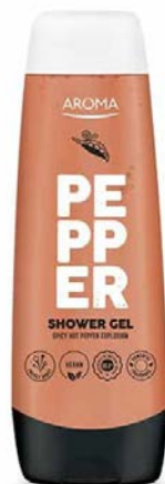
Sprchový gel KOŘENÍ