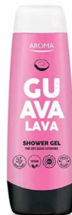
Sprchový gel GUAVA LAVA