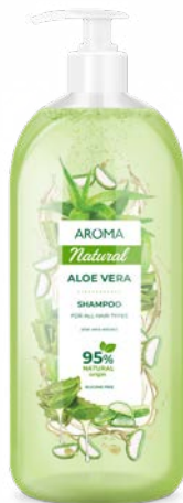
Pro zdravý vzhled vlasů ALOE VERA S PUMPIČKOU