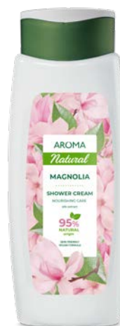
Sprchový krém MAGNÓLIE 3464 400 ml