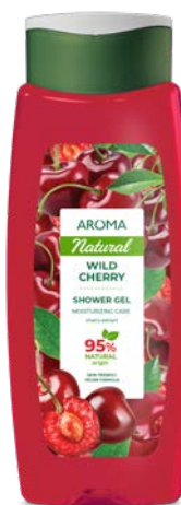
Sprchový gel DIVOKÁ TŘEŠEŇ 3463 400 ml