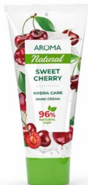
Krém na ruce SLADKÁ TŘEŠEŇ