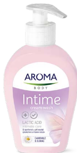
KRÉMOVÝ GEL NA INTIMNÍ HYGIENU HEŘMÁNEK