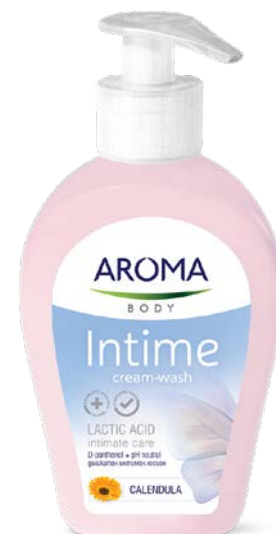
KRÉMOVÝ GEL NA INTIMNÍ HYGIENU MĚSÍČEK