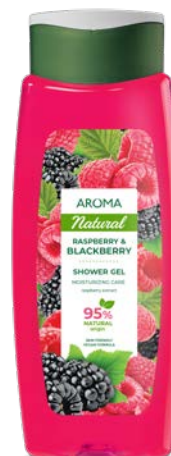
Sprchový gel MALINA A OSTRUŽINA 3460 400 ml