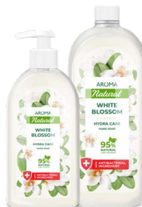
Mýdlo na ruce BÍLÝ KVĚT