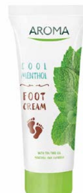
Krém na nohy SVĚŽÍ MENTOL