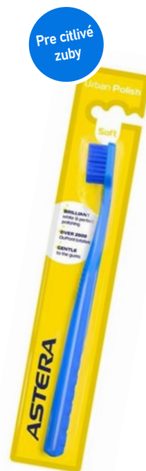
Zubní kartáček URBAN POLISH