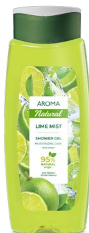
Sprchový gel LIMETKOVÁ MLHA 3462 400 ml