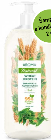
Na suché vlasy PŠEŇIČNÝ PROTEIN S PUMPIČKOU