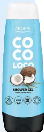
Sprchový gel COCO LOCO