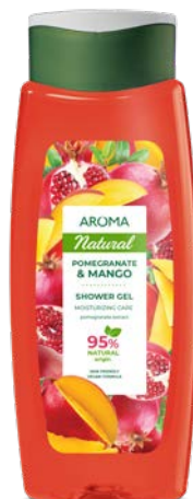
Sprchový gel GRANÁTOVÉ JABLKO A MANGO 3458 400 ml