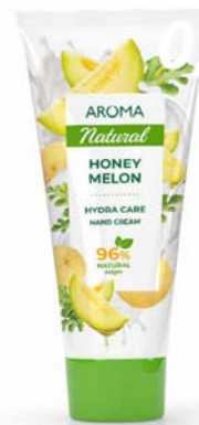
Krém na ruce MEDOVÝ MELOUN