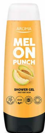
Sprchový gel MELOUNOVÝ PUNČ