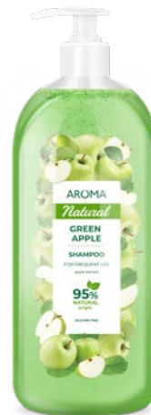
Na časté použití ZELENÉ JABLKO S PUMPIČKOU