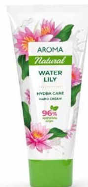
Krém na ruce LEKNÍN S VŮNÍ OVOCE