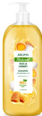
Na poškozené vlasy MED A VAJÍČKO S PUMPIČKOU