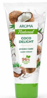
Krém na ruce KOKOSOVÉ POTĚŠENÍ