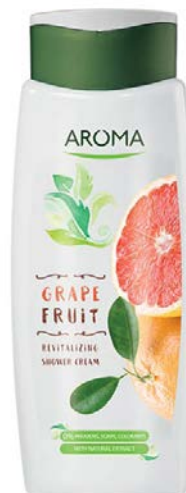
Sprchový krém GRAPEFRUIT