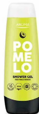
Sprchový gel POMELO