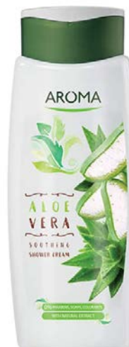
Sprchový krém ALOE VERA