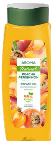
Sprchový gel BROSKEV A KAKI 3459 400 ml