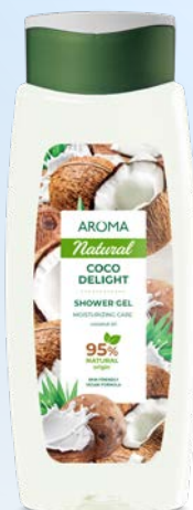
Sprchový gel KOKOSOVÉ POTĚŠENÍ 3461 400 ml