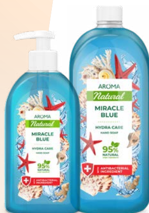
Mýdlo na ruce ZÁZRAČNÁ MODRÁ