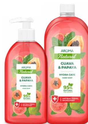
Mýdlo na ruce GUAVA A PAPÁJA