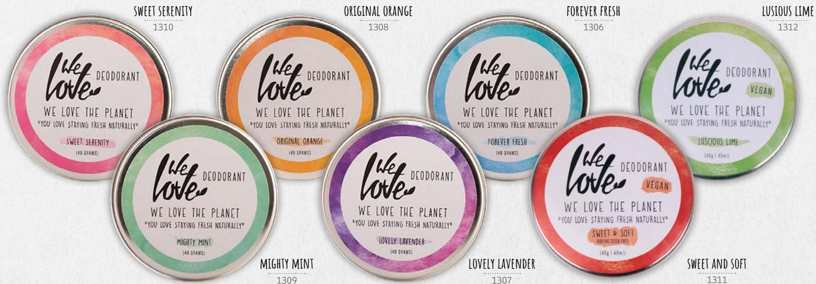
SWEET SERENITY 1310