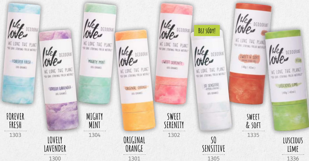
FOREVER FRESH 1303

sódy bikarbóny chráni pred potom a nežiaducim zápachom a zároveň neblokuje póry. Jedno balenie vystačí na 2 až 3 mesiace.