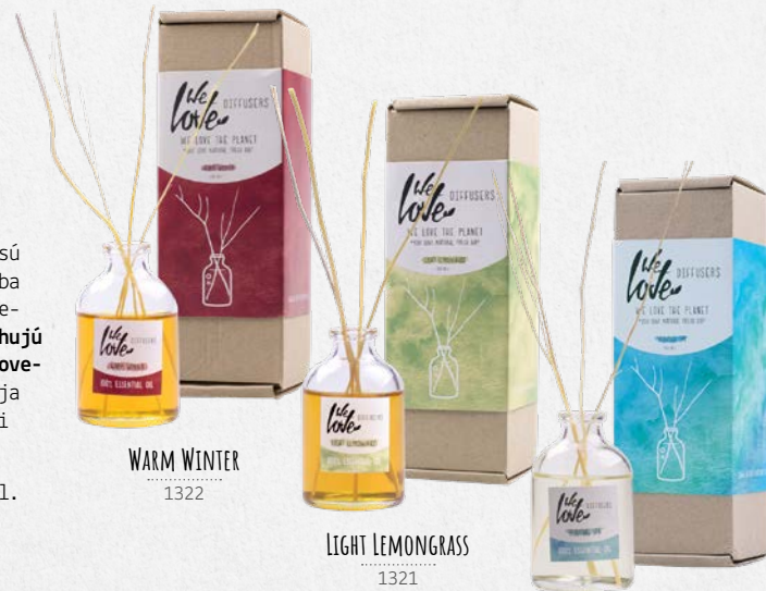
WARM WINTER 1322