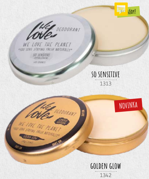
SO SENSITIVE 1313

Rovnako ako kokosový olej výborne hydratujú a regenerujú. Táto zložka sa skladá z karboxylových kyselín, ktoré sú identické s tukmi už prítomnými v pokožke.