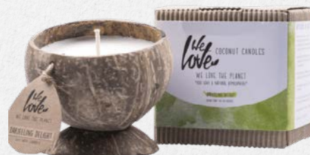
DARJEELING DELIGHT 1345