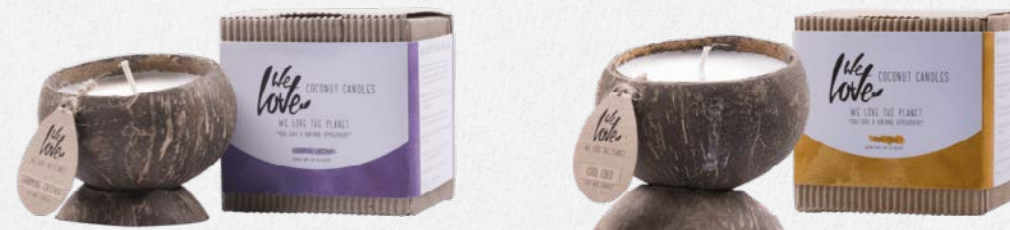
CHARMING CHESTNUT 1343

Sójový vosk pochádza zo Spojených štátov z ekologickej a zodpovednej sójovej plantáže.