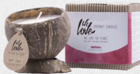
SWEET SENSES 1346