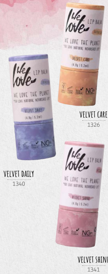
VELVET CARE 1326

Balzam na pery sa dodáva v inovatívnom, recyklovanom obale vyrobenom zo zmiešaného papiera FSC. Je to známa push-up tyčinka.