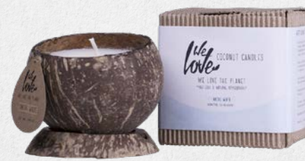
ARCTIC WHITE 1347