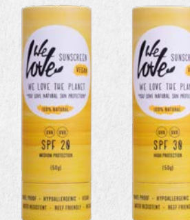
SPF 20 1330