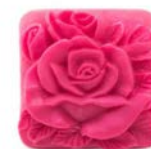
RŮŽOVÝ KVĚT ČTVEREC