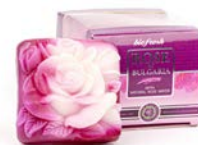
RŮŽE ČTVEREC V KRABIČČCE