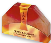
BROSKYŇA A JOGURT