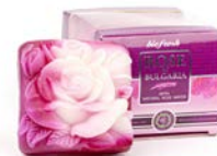
RUŽA ŠTVOREC V KRABIČKE